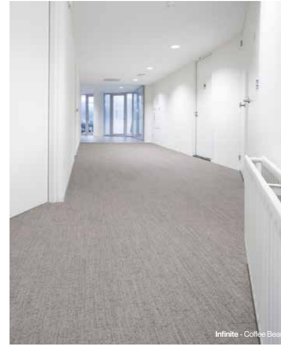
Infinite - Coffee Bean

Grâce aux nombreuses options de couleurs et aux designs polyvalents de 2TEC2, vous pouvez personnaliser les espaces de soins pour un confort maximal des patients. Nos diverses collections offrent une multitude de motifs et de couleurs en rouleaux, en planches et en dalles, ce qui permet une grande souplesse d'installation pour un environnement unique.