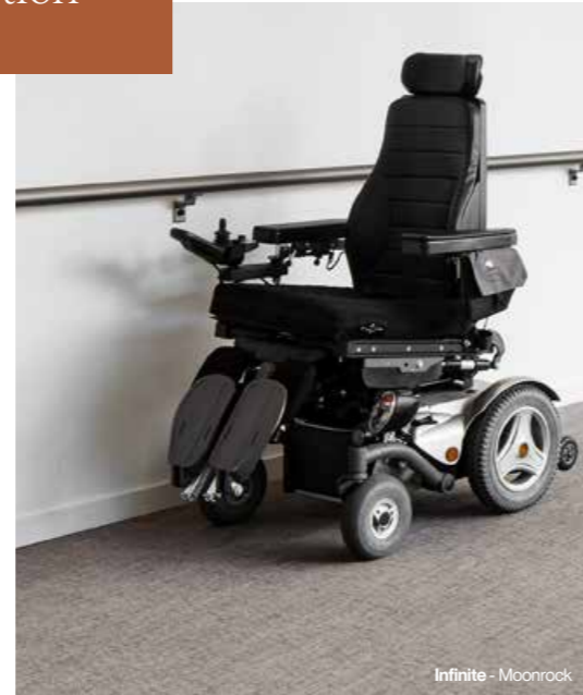
Infinite - Moonrock

Grâce aux nombreuses options de couleurs et aux designs polyvalents de 2TEC2, vous pouvez personnaliser les espaces de soins pour un confort maximal des patients. Nos diverses collections offrent une multitude de motifs et de couleurs en rouleaux, en planches et en dalles, ce qui permet une grande souplesse d'installation pour un environnement unique.