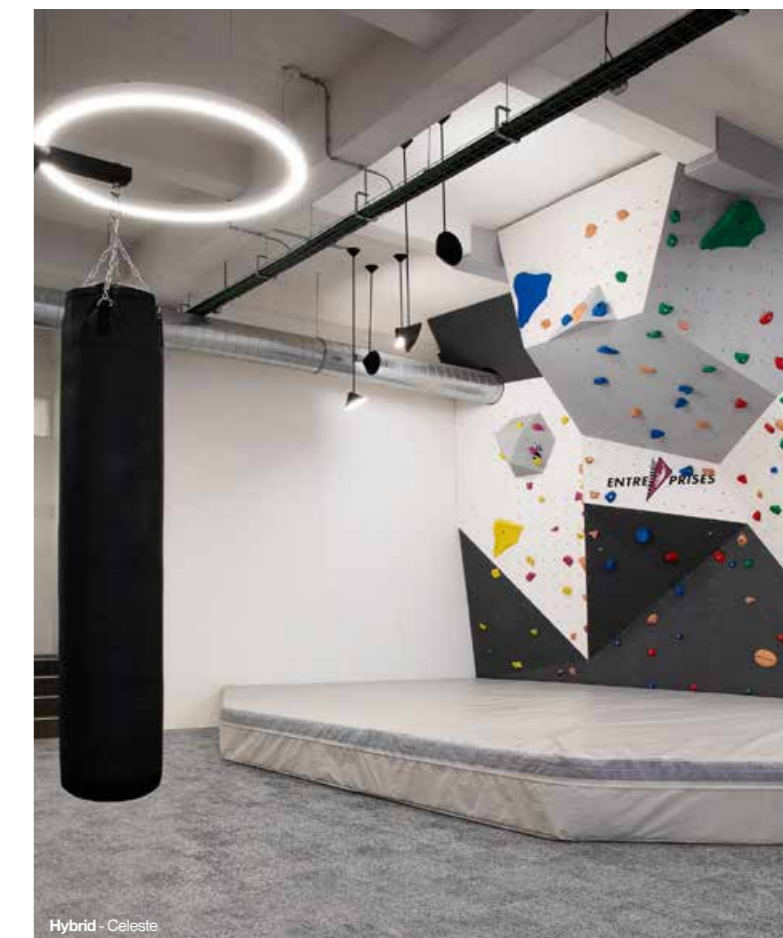
Hybrid - Celeste