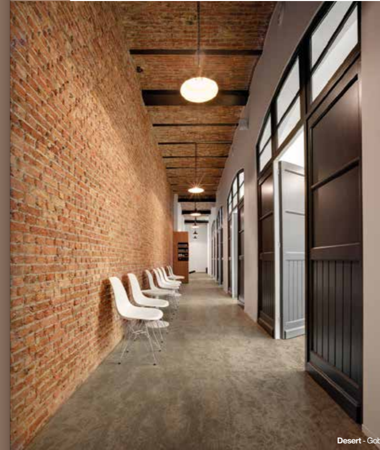
Desert - Gobi