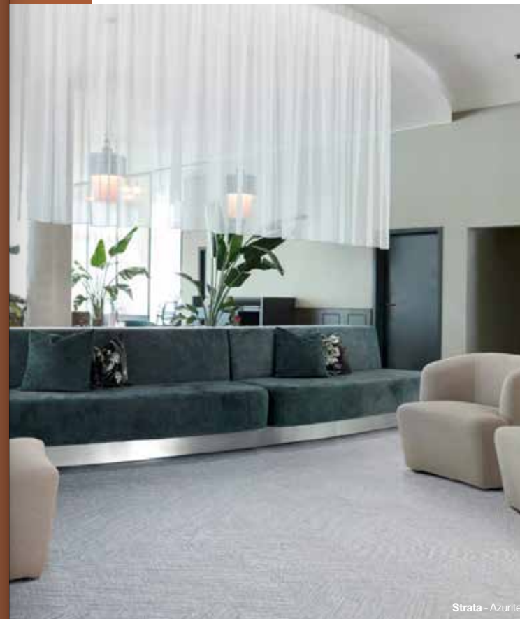
Strata - Azurite