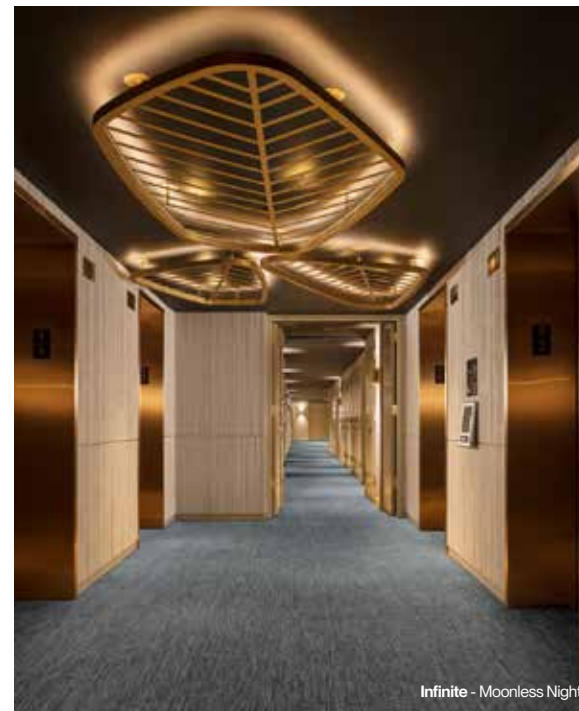
Infinite - Moonless Night