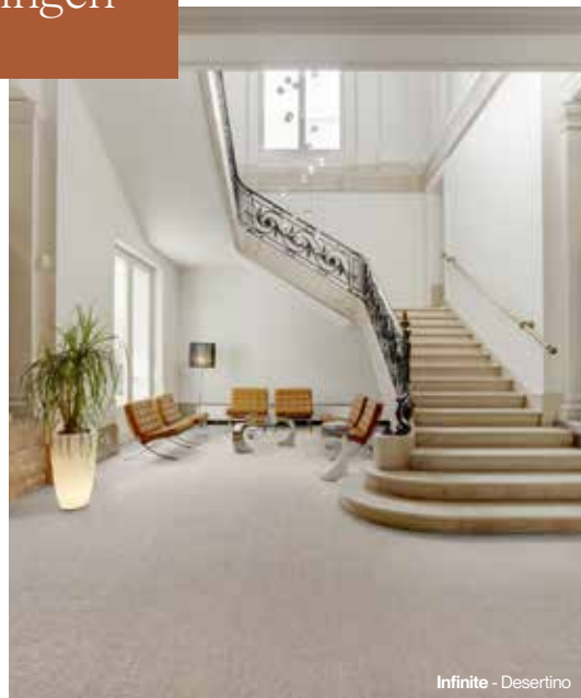
Infinite - Desertino

De horeca bestaat uit diverse ruimtes, variërend van hotellobby's, gastenkamers en suites tot fitnesscentra, restaurants, zwembaden, buitenlounges en nog veel meer. Bij 2TEC2 bieden onze geweven hightech vloeroplossingen een uitgebreide reeks referenties die zijn afgestemd op de unieke eisen van elke horeca-omgeving.