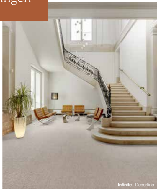
Infinite - Desertino

De horeca bestaat uit diverse ruimtes, variërend van hotellobby's, gastenkamers en suites tot fitnesscentra, restaurants, zwembaden, buitenlounges en nog veel meer. Bij 2TEC2 bieden onze geweven hightech vloeroplossingen een uitgebreide reeks referenties die zijn afgestemd op de unieke eisen van elke horeca-omgeving.