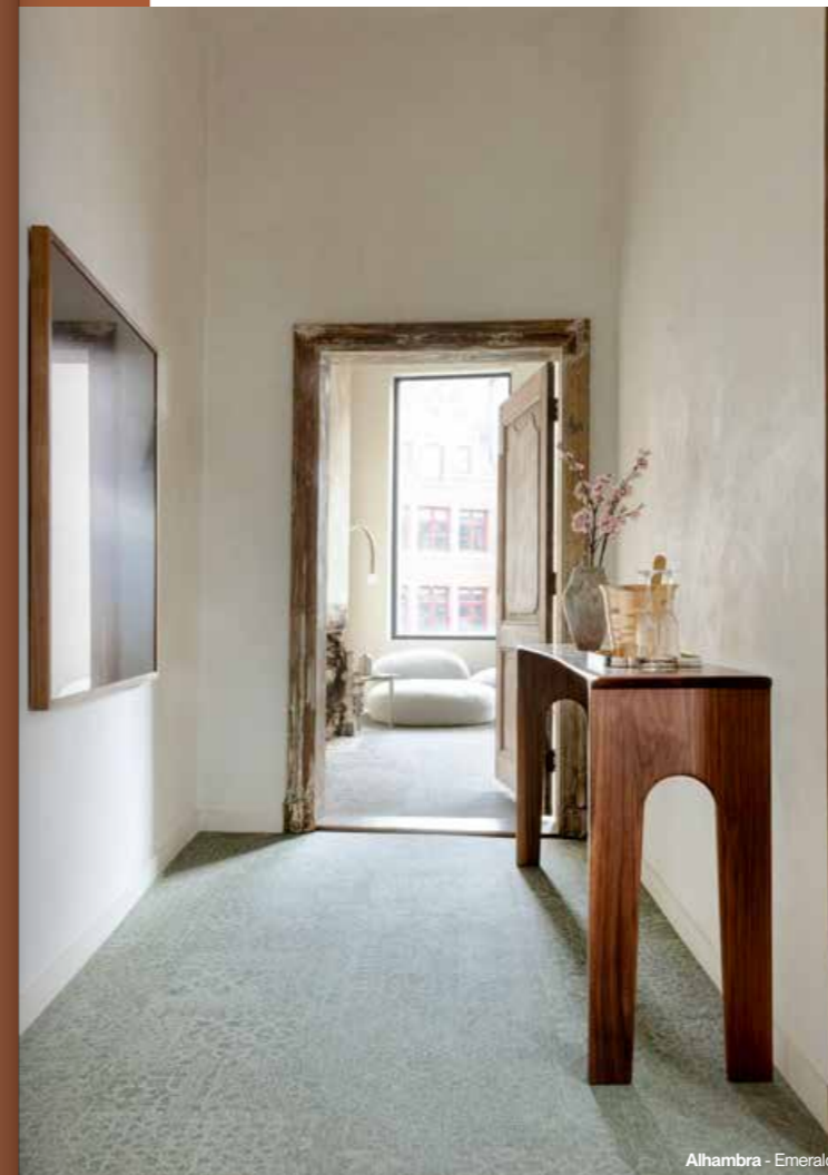
Alhambra - Emerald