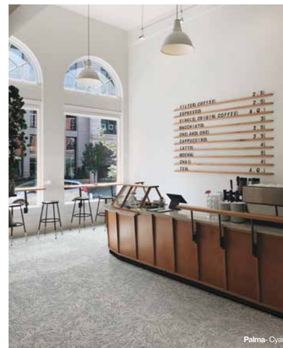
Palma - Cyan