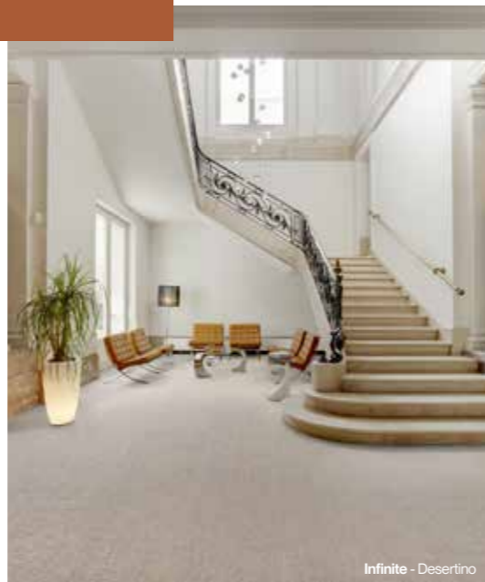
Infinite - Desertino

L'industria dell'ospitalità comprende diversi spazi che vanno dalle lobby, le camere e le suite degli alberghi ai centri fitness, i ristoranti, le piscine, i saloni esterni e non solo. In 2TEC2, le nostre soluzioni di pavimentazione ad alta tecnologia in tessuto offrono una gamma completa di referenze su misura per soddisfare le esigenze uniche di ogni ambiente di adibito all'ospitalità.