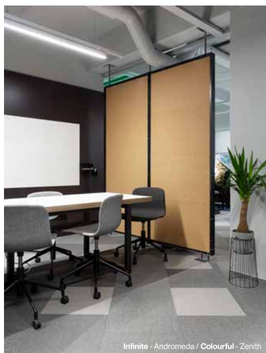
Infinite - Andromeda / Colourful - Zenith