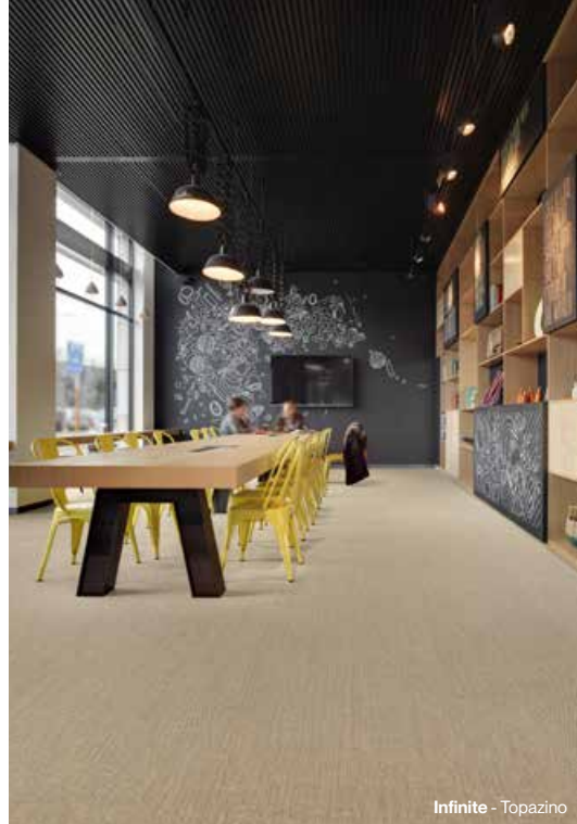
Infinite - Topazino